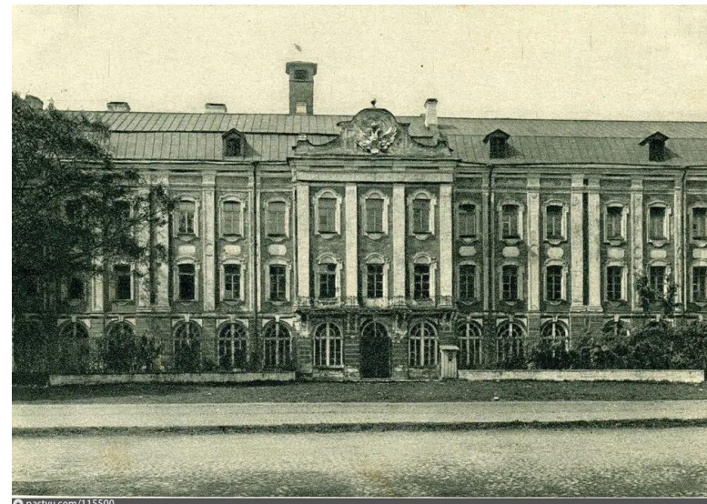
Ленинградский государственный университет имени А.С.Пушкина, Санкт- Петербург

Окончил Ленинградский государственный университет. С 1956 года – научный сотрудник сектора языка и письменности Бурятского научно-исследовательского института в Улан-Удэ.